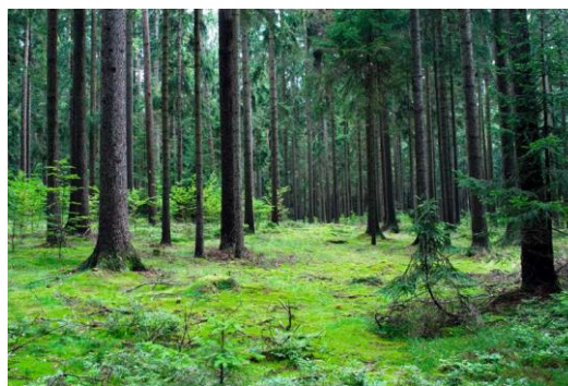
Bilde 2 Statskog SF

Til sammen utgjør det vernede og foreløpig båndlagte arealet på Statskogs grunn på Helgeland nå over 470 000 dekar. Dette utgjør ca. 30 % av det produktive skogarealet til Statskog, noe som representerer en stående kubikkmasse på omlag 690 000 m 3 som ikke er tilgjengelig for drift.